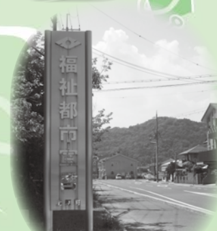
福祉都市宣言から58年。 上郡駅前にある立て看板

問い合わせ 上郡町立図書館 ☎52-4611 上郡町社会福祉協議会 ☎52-2910